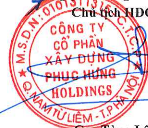
Cao Tùng Lâm