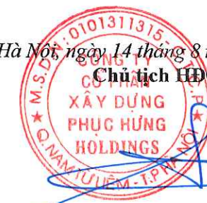
Cao Tùng Lâm