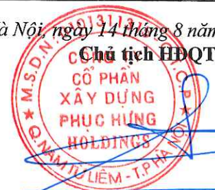
Cao Tùng Lâm