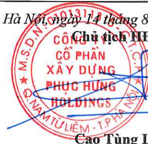
Cao Tùng Lâm