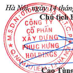
Cao Tùng Lâm