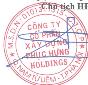
Cao Tùng Lâm