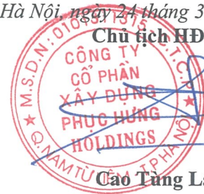
Cao Tùng Lâm