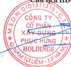
Cao Tùng Lâm