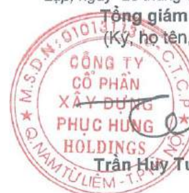
Trần Huy Tường