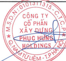
Cao Tùng Lâm Chủ tịch Hội đồng quản trị

Các thuyết minh từ trang 08 đến trang 41 là một bộ phận hợp thành của Báo cáo tài chính tổng hợp