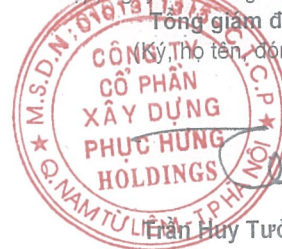
Trần Huy Tường